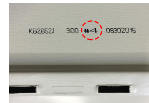
# de planche

* Il est important d'y porter une attention particulière et de procéder à l'installation des planches de façon aléatoire afin d'optimiser l'effet bois. Ne jamais reproduire la même séquence de pose pour éviter de créer un effet tapisserie.