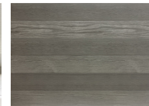
6 planches | 6 nuances